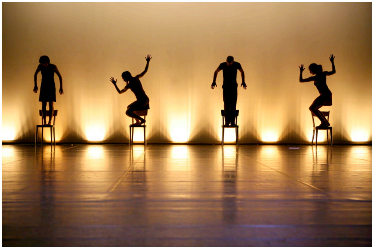
> Chronique d'un poème que le poète n'a jamais écrit